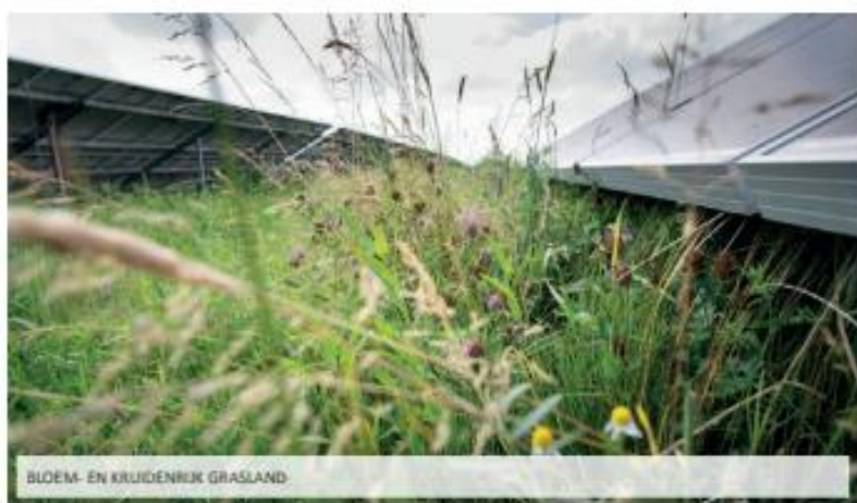
BLOEM- EN KRUIDENRIJK GRASLAND